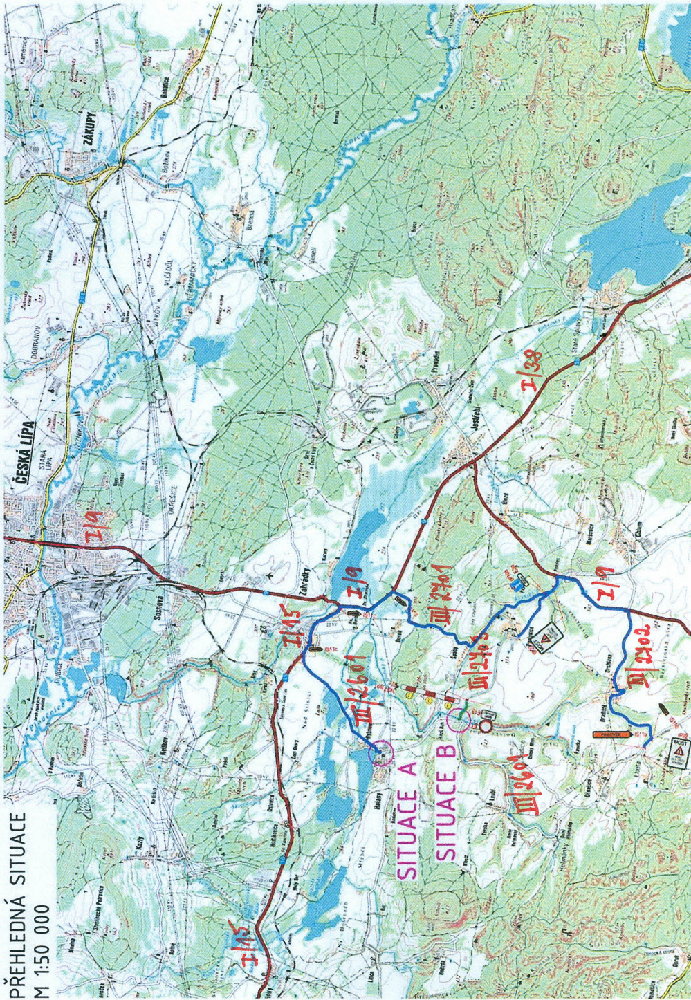
PŘEHLEDNÁ SITUACE M 1:50 000